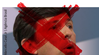
João Amoêdo (NOVO)

► Defende a educação à distância desde o ensino fundamental. Diz que vai apoiar o Projeto Escola Sem Partido para combater a "doutrinação esquerdista" e a "ideologia de gênero" dentro das escolas.