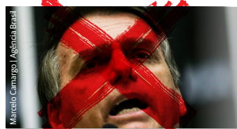
Jair Bolsonaro (PSL)

► Defende a educação à distância desde o ensino fundamental. Diz que vai apoiar o Projeto Escola Sem Partido para combater a "doutrinação esquerdista" e a "ideologia de gênero" dentro das escolas.