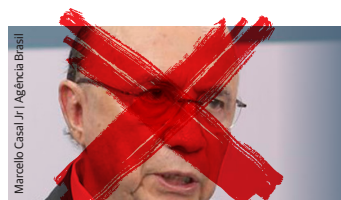
Henrique Meirelles (MDB)

► Tratou com violência todas as manifestações dos professores como governador de São Paulo e implementou políticas meritocráticas para educação do estado.