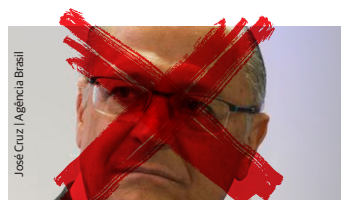
Geraldo Alckmin (PSDB)

► Defende a privatização da educação básica por meio de parcerias público-privadas e propõe mensalidade nas universidades públicas.